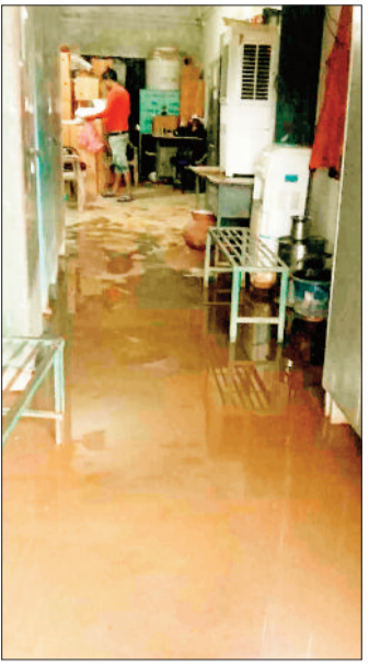
बीईओ कार्यालय के कमरे में भरा बारिश का पानी।

विकासखंड शिक्षा कार्यालय भवन काफी पुरानी हो चुकी है। वर्षों पुराने भवन के समय समय पर मरम्मत नहीं होने से अब खंडहर में तब्दील हो गया है। ठंड व गर्मी के मौसम में किसी तरह कर्मचारी विभागीय कामकाज करते हैं लेकिन बरसात के दिनों में भवन में सीपेज होने के कारण अधिकारी समेत कर्मचारियों को काफी दिक्कतों का सामना करना पड़ रहा है। इधर प्रदेश में मानसून दस्तक दे चुका और अब बारिश भी होने लगी है। गुरुवार की दोपहर भी जिले में रूक रूक कर झमाझम बारिश हुई। लगभग एक घंटे तक हुई झमाझम बारिश से बीईओ कार्यालय भवन में जगह